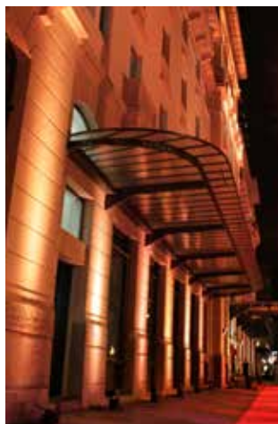
Lugdunum - Lyon (69) 23 000 m 2 réhabilitation tertiaire maître d'ouvrage : Sogelym Dixence